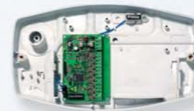
SPEED 8 STD