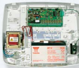
SPEED ALM8 PL